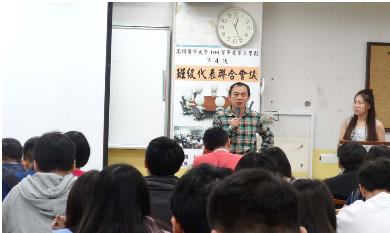
總務處事務組組長宣導(2017.12.26 於 CSB-101)