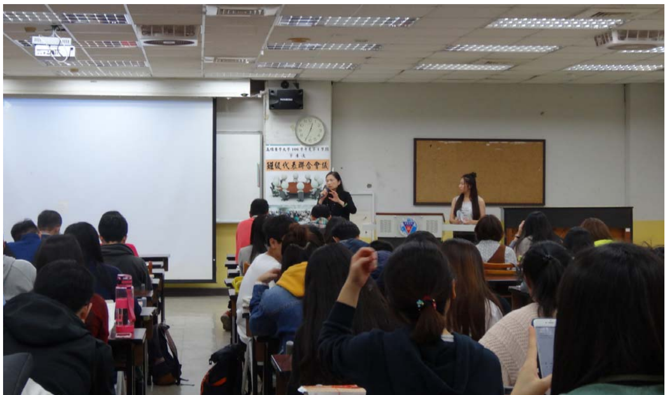
生輔組宣導事項報告(2017.12.26 於 CSB-101)