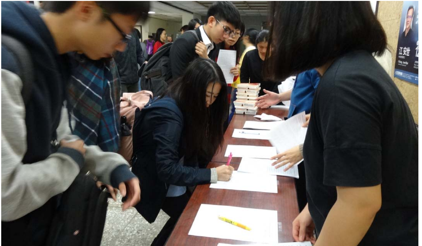
第四次代聯會報到狀況(2017. 12. 26 於 CSB-101)