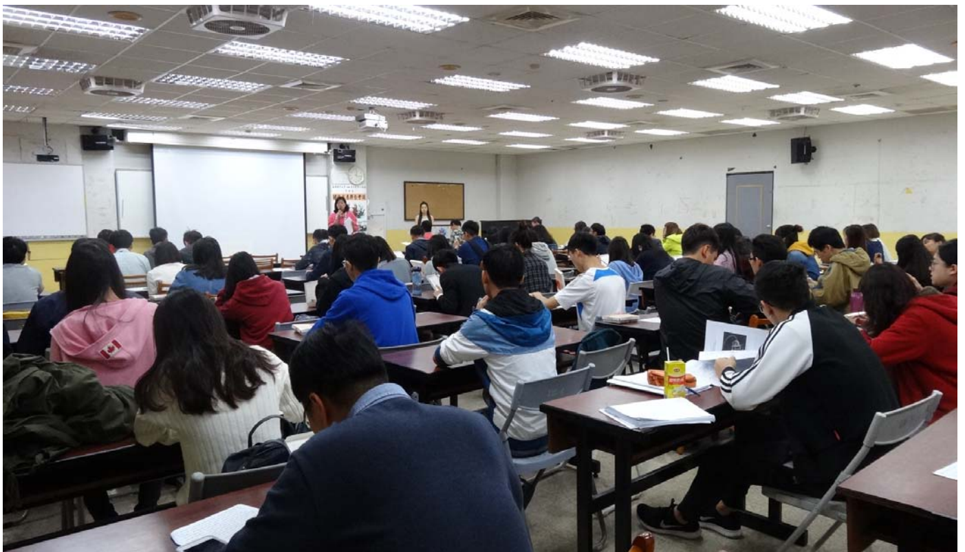
第四次代聯會出席狀況(2017. 12. 26 於 CSB-101)