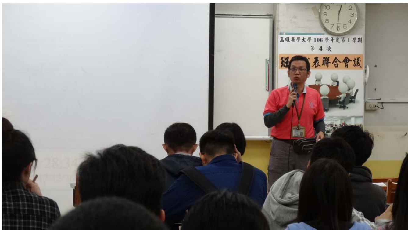
總務處營繕組組長宣導(2017.12.26 於 CSB-101)