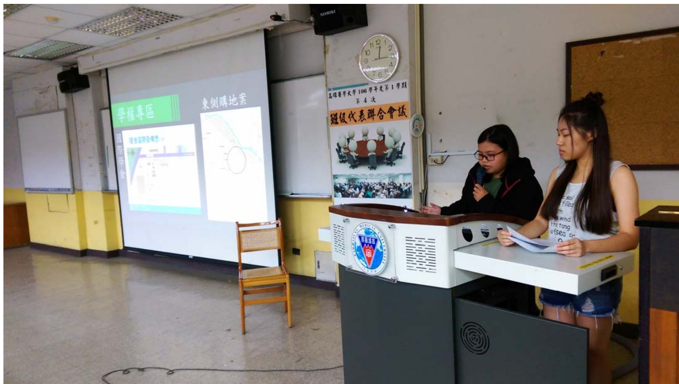
學生會會務宣導 (2017. 12. 26 於 CSB-101)