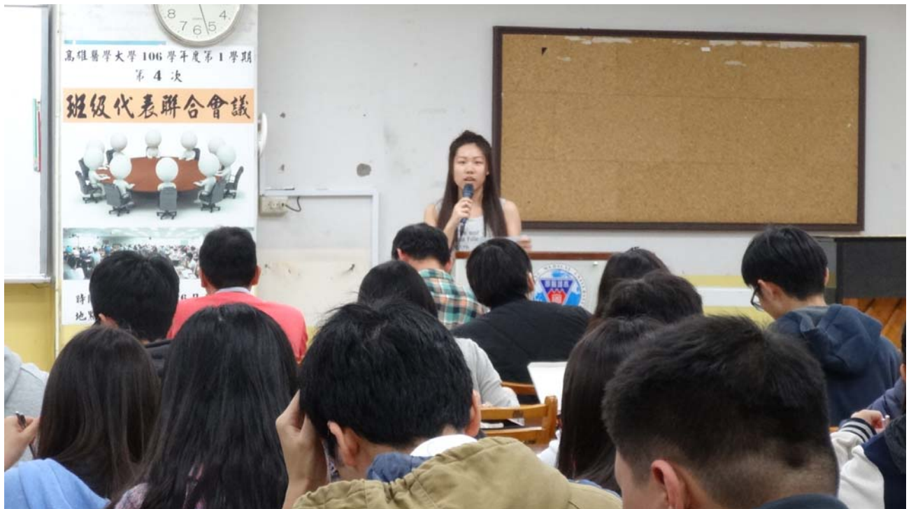
代聯會主席報告(2017.12.26 於 CSB-101)