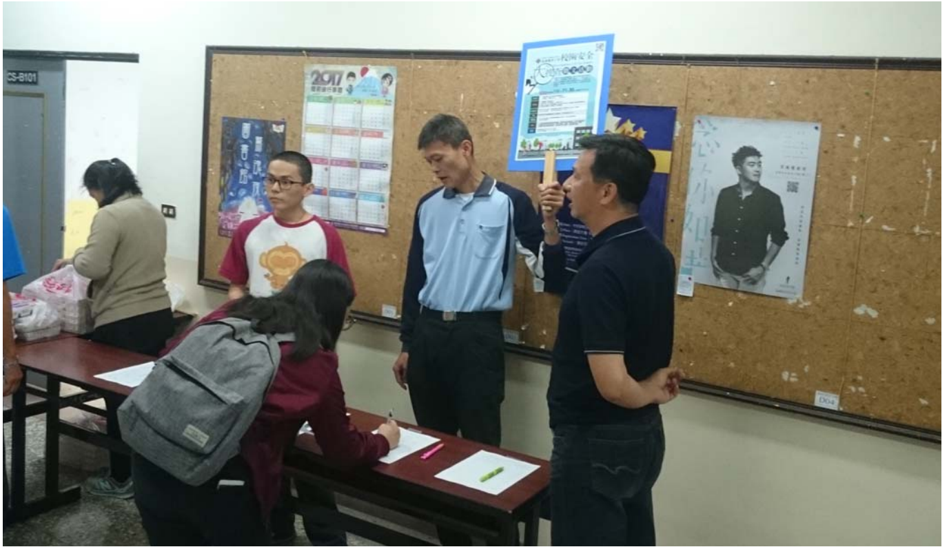
校園安全大搜查宣導 (2017.11.28 於 CSB-101)