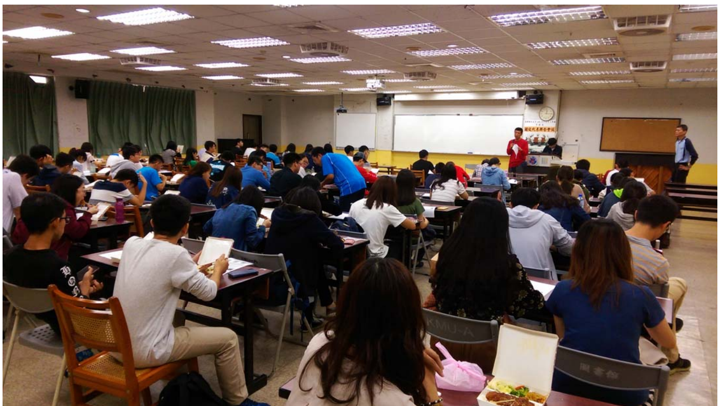
第三次代聯會出席狀況(2017. 11. 28 於 CSB-101)