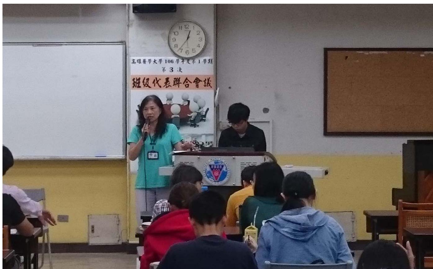
生輔組宣導事項報告(2017. 11. 28 於 CSB-101)