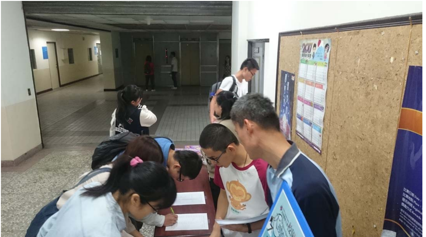
第三次代聯會報到狀況(2017. 11. 28 於 CSB-101)