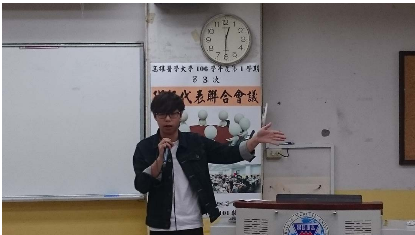
代聯會副主席報告(2017. 11. 28 於 CSB-101)