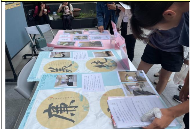
報名參加房東簽到