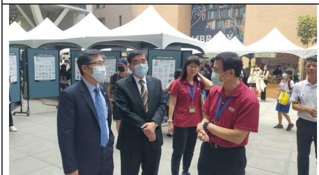
主任向董事長與校長報告活動辦理情形