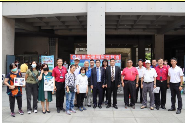
董事長、校長與優良房東合影