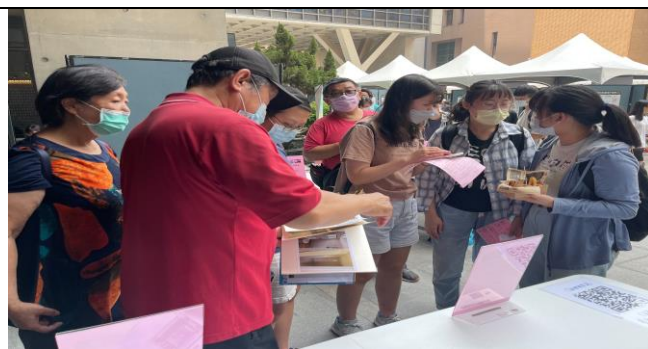
學生向房東詢問校外租屋資訊