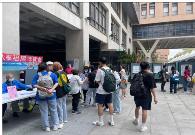
學生絡繹不絕前往洽詢