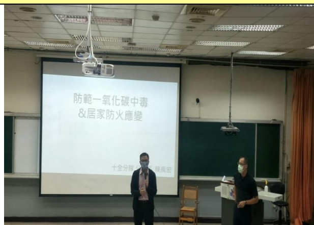
張主任介紹授課講座