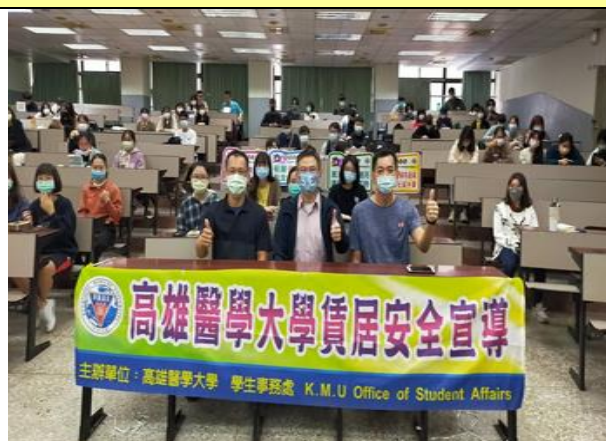
張主任開場白與講座合影