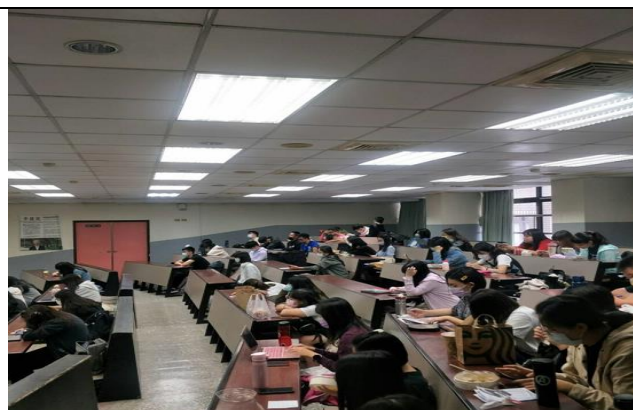
講師與學生互動情形