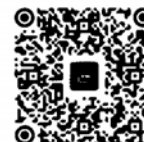
慧炬 YouTube 影音頻道