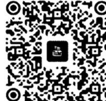
慧炬 YouTube 影音頻道