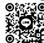
慧炬 Line App 官方帳號