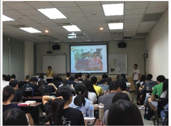
活 動 照 片