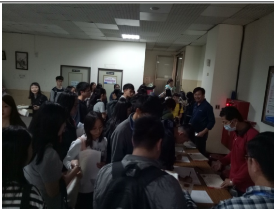
參加同學簽名報到