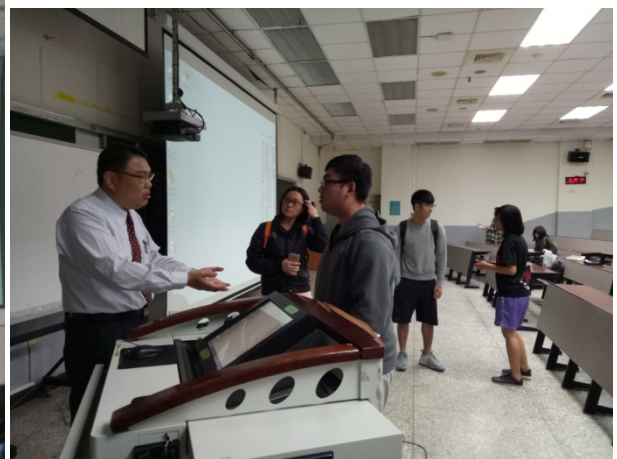
講座後同學個別提問相關問題