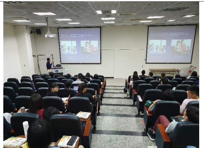
活 動 照 片