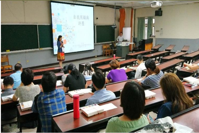
學 務 長 致 詞