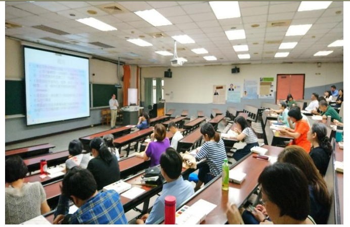
教 職 員 專 心 聆 聽