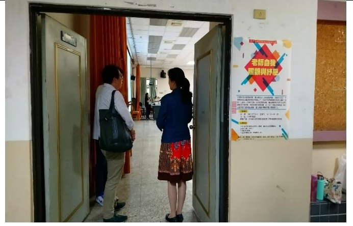
活 動 海 報