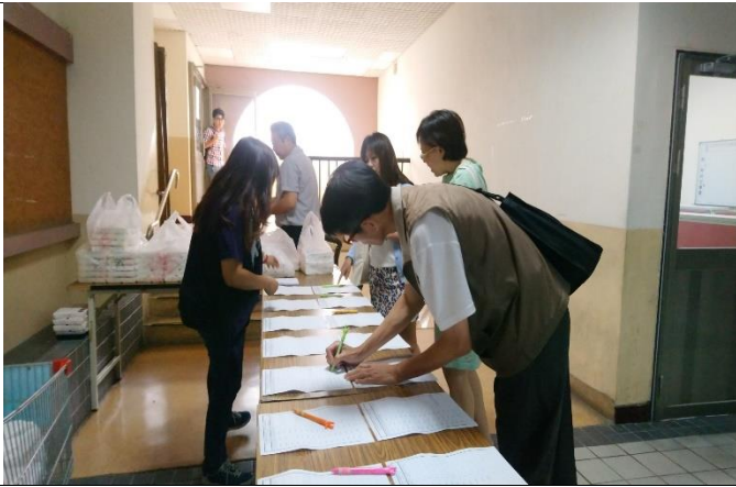
活 動 花 絮