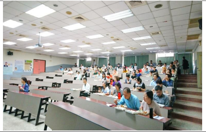
教 職 員 熱 烈 參 與 活 動