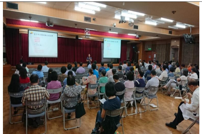
教職員熱烈參與活動