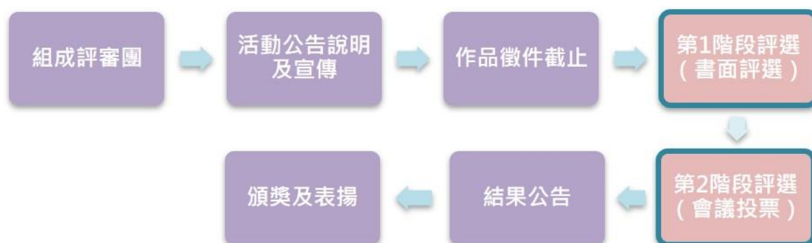
圖 防災士 LOGO 設計徵選活動流程

(2) 第1階段將請委員簽署評選委員確認單(如附件8)，以確認參與本次評選(如圖)。