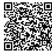
社會大眾報名專頁 11/20開放，額滿為止