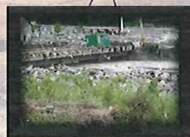
2004年 艾利颱風 新竹縣艾利颱風搶救記實