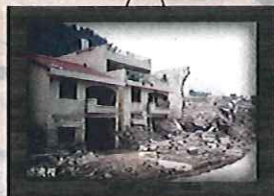
1996年 賀伯颱風 潘國樑