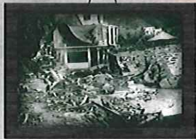
1973 娜拉颱風 水土保持局第五工程所