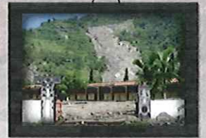
2007年 0809豪雨 陳振宇