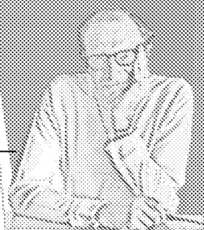
Eric Berne, Founder

伯恩的理論由一些關鍵概念組成，像是我好，你也好(I'm OK—You're OK)、心理遊戲(Games)、安撫(Strokes)、自我狀態(Ego States)、互補/交錯/曖昧的溝通(Transactions)、人生腳本(Life Script)、合約(Contracts)等，專業人員用這些概念來幫助個案、學生和組織，分析和改變影響實現生活的互動模式。TA自創立至今，已被65個國家學習並廣泛應用於精神醫學、臨床與諮商心理、學校教育、企業組織與個人成長領域。