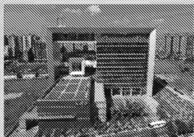
民視數位媒體總部 新北市林口區信義路99號